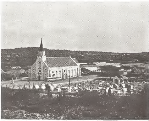
Un vista di e iglesia di Santa Ana den Parokia di Noord. E parokia di Noord ta recorda e fecha cu dos cien aña pasa el a worde funda. E iglesia ta un atraccion completo pa turista ya cu su altar ta traha di obra di man.

Considerando e bon resultado cu e luznan aki ta dunando, Gobierno di Aruba ta planeando awor pa laga haci un estudio di henter Aruba pa determina na ki otro puntonan lo ta beneficoso pa instala tal luznan. Cu e pasonan aki, pues, e gobierno actual ta mehorando un situacion ariba nos carteranan cual e gobiernonan den pasado a negligha totalmente.